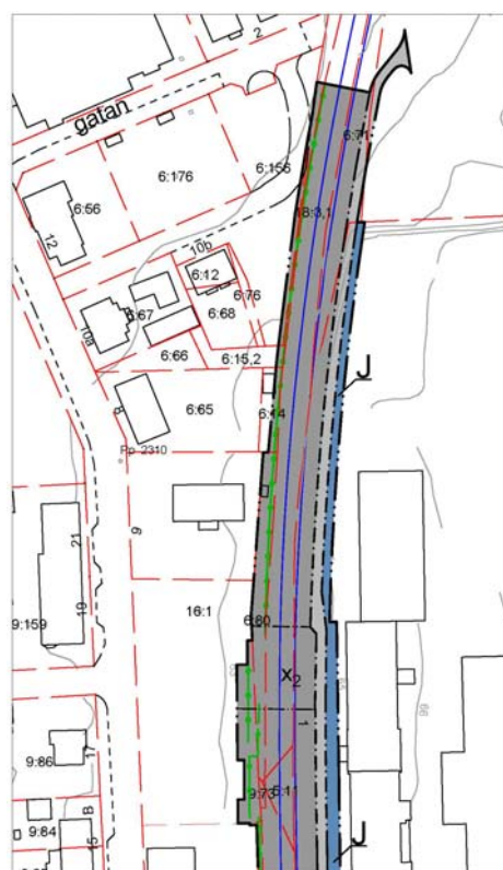
Norra delen av planområdet