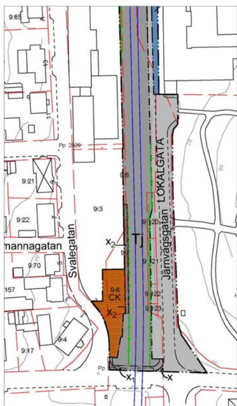
Södra delen av planområdet