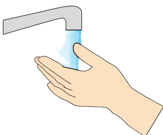
Tvätta händerna ofta