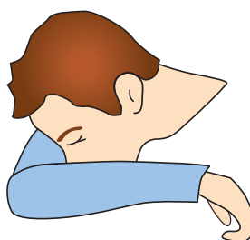
Hosta och nys i armvecket