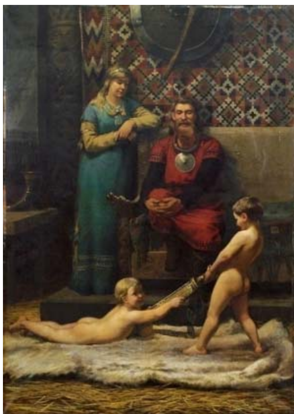
"Lek i Foajen" målad 1879 av Wilhelm Peters (1851 – 1935).