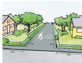
Illustrationer: SKL:s broschyr "Klipp häcken".

Du som har utfart mot gata Om ni har en fastighet med utfart mot gatan så får växtligheten inte växa ut över gata/gångbana och inte vara högre än 80 cm inom det mått-satta området.