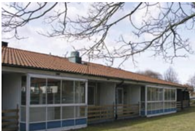
Solgården i Svalöv