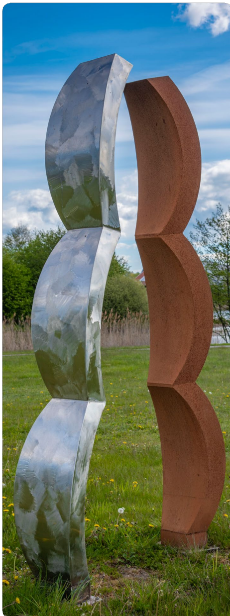
Skulpturparken - Svalövssjön