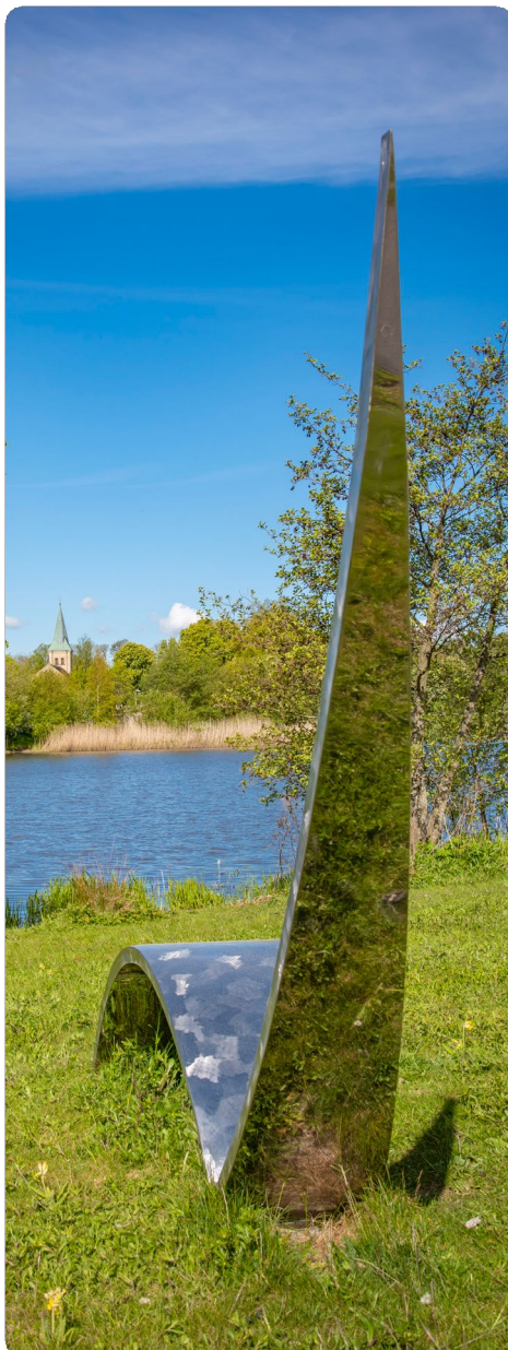
Skulpturparken - Svalövssjön

Ansökningsblankett om jämkning finns hos det särskilda boendet, kommunens hemsida eller hos avgiftshandläggaren.